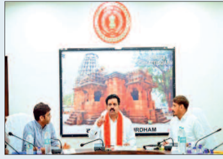
समन्वय के साथ कार्य करें और किसी भी प्रकार की कमी या समस्या को तत्काल दूर करते हुए सभी तैयारियां समय पर पूर्ण करें।

उप मुख्यमंत्री विजय शर्मा ने जिले में आगामी सत्र से प्रारंभ होने वाले मेडिकल शिक्षा सत्र की तैयारियों की विस्तार से समीक्षा करते हुए अधिकारियों को स्पष्ट निर्देश दिए कि मेडिकल कॉलेज प्रारंभ करने के लिए आवश्यक सभी मूलभूत व्यवस्थाएं सम्पूर्णता से पूर्ण की जाएं। उन्होंने कहा कि किसी भी स्थिति में प्राथमिक सेटअप में कमी नहीं रहनी चाहिए। मेडिकल कॉलेज के सुचारू संचालन के लिए जो व्यूलाभ सेटअप आवश्यक होता है, उसे प्राथमिकता के आधार पर पूरा किया जाना सुनिश्चित करें। उप मुख्यमंत्री ने इन सभी कार्यों को प्राथमिकता के साथ पूर्ण करने पर विशेष जोर दिया। बैठक के दौरान उन्होंने मेडिकल स्टाफ और विद्यार्थियों के लिए आवासीय व्यवस्था रैसिडेंस के संबंध में भी विस्तृत जानकारी ली। उन्होंने निर्देशित किया कि नियमानुसार कॉलेज और रैसिडेंस के आवास के बीच निहारित दूरी का पालन किया जाए तथा इसी को ध्यान में रखते हुए आवासीय व्यवस्था विकसित की जाए। उप मुख्यमंत्री श्री शर्मा ने कहा कि मेडिकल कॉलेज की शुरुआत जिले के लिए एक महत्वपूर्ण उपलब्धि है, इसलिए सभी संबंधित विभाग आपसी