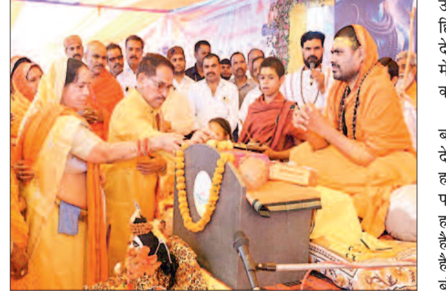
हरिभूमि न्यूज >>> कवर्धा